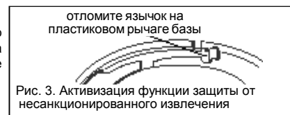
Рис. 3. Активизация функции защиты от несанкционированного извлечения